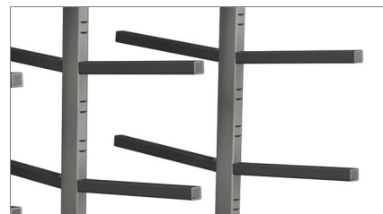
Επιφάνειες επαφής 02