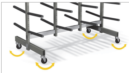
Περιστρεφόμενοι τροχοί 01