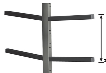
Ρυθμιζόμενα κεντρικά στηρίγματα 03

Το Stack είναι ένα καρότσι για τη μεταφορά και την αποθήκευση προφίλ σε οριζόντια θέση.