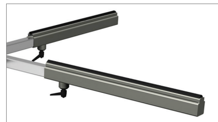
Επιφάνεια καλυμμένη με αντιολισθητικό PVC 02