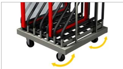
Περιστρεφόμενοι τροχοί 01