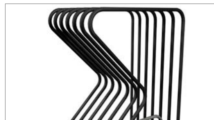
Επιφάνειες επαφής πλευρικά 02